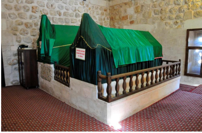
Hatuniye Medresesi, Türbe İçi, Kabirlerin Genel Görünüşü. 10

Hatuniye Medresesi mescidinde içinde Peygamber Efendimiz Hz. Muhammed (S.A.V.)'e ait olduğu kabul edilen ayak izi'de bulunmaktadır. Yavuz Sultan Selim Mısır seferine giderken Diyarbakır ve Mardin civarlarından geçer. Mardin halkı kendi gönlüyle şehrin anahtarını Yavuz'un komutanlarına teslim ederler. Sultan Selim, Mardinlilerin bu davranışını çok beğenir ve Mısır seferinden dönerken, kutsal emanetlerden bir kısmını Mardin emirine bırakıp Mardinliler'i ödüllendirir.