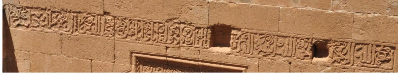
En üstte bulunan dikdörtgen kitabe

Kim Allah'a tevekkül ederse O kendisine yeter 6 .