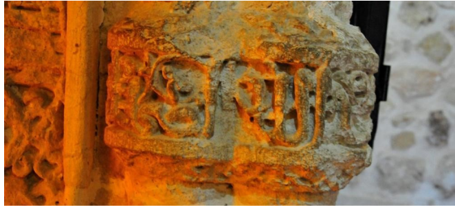
Hatuniye Medresesi, Mihrap, Sütünce İhlas Suresi'nin Son Yarısı

Mihrabın batısında bir tanesi büyük iki adet niş vardır. Büyük olan basık kemerlidir. Küçük olan da ise “kadem-i saadet” yer almaktadır.