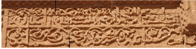
Ortada bulunan dikdörtgen kitabe

Mardin Ulu Cami Külliyesine Ait Vakfiyenin Diğer Kısımları (VGMA'dan) 7