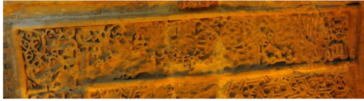
Hatuniye Medresesi, Mihrap Nişі Tevbe Suresi Ayet 21