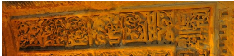
Hatuniye Medresesi, Mihrap Nişі Tevbe Suresi Ayet 22