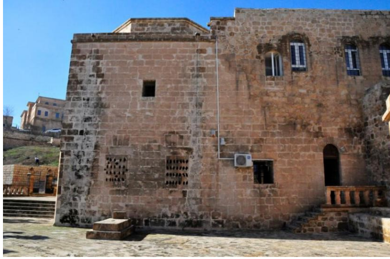
Hatuniye Medresesi ve Türbenin Doğu Cepheden Görünüşü