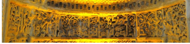
Hatuniye Medresesi, Mihrap Nişі Tevbe Suresi Ayet 22