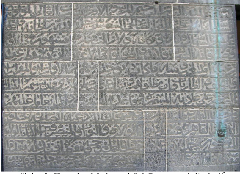
Çizim 2: Hatuniye Medresesi (M. Baran Arşivi'nden) 9