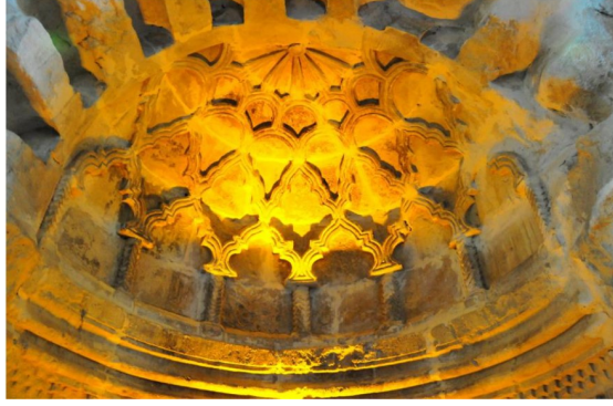
Hatuniye Medresesi, Türbe İçi, Mihrap kavсарası