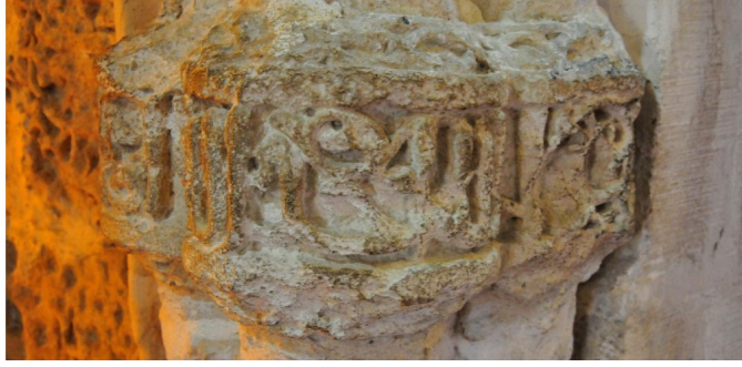
Hatuniye Medresesi, Mihrap, Sütünce İhlas Suresi'nin İlk Yarısı