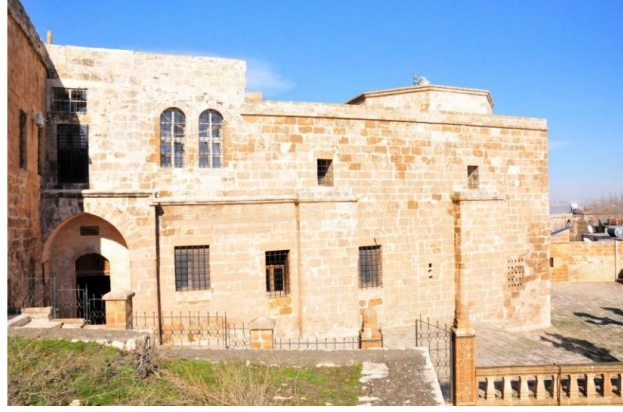
Hatuniye Medresesi ve Türbenin Güney Cepheden Görünüş